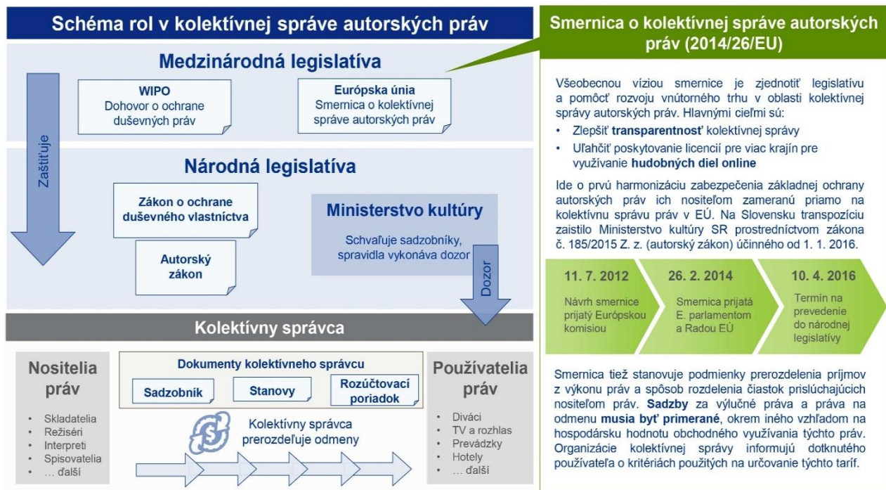
Graf 1 Systém medzinárodnej a národnej legislatívy autorských práv.